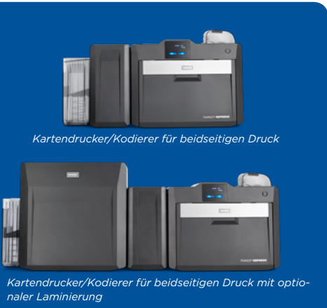
Kartendrucker/Kodierer für beidseitigen Druck

Der HDP6600 nutzt die innovative abfallfreie Laminierertechnologie* von HID Global und eliminiert so die Verwendung der üblichen Trägerfolie und des Aufwickelkerns, die in den meisten aktuell auf dem Markt erhältlichen Laminiermaterialien enthalten sind. Der HDP6600 ist der einzige desktopbasierte Retransfer-Drucker auf dem Markt, der moderne abfallfreie Laminierertechnologie bietet und kann die Materialkosten beim volumenstarken Laminieren um bis zu 40 Prozent senken. Neben den Kosteneinsparungen bei den Verbrauchsgütern verlängern die abfallfreien Schutzlaminierfolien* PolyGuard™ LMX dank optimalem Schutz die Lebensdauer Ihrer Karten.