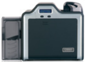
Kartendrucker/Kodierer für einseitigen Druck

High Definition-Druck bietet die beste Bildqualität - auf Karten mit höchster Funktionalität. Die HDP-Folie wird auf die Oberfläche der Proximity- und Chipkarten aufgebracht und passt sich den Erhöhungen und Vertiefungen der integrierten Elektronik an.