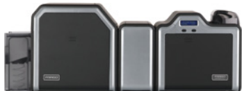
Laminiereinheit und Kartendrucker/Kodierer für beidseitigen Druck

Modulares Design für höchste Flexibilität. Sie suchen ein Ausweiskartensystem, das sich flexibel an Ihre Bedürfnisse anpassen lässt? Kein Problem. Der HDP5000 wächst mit Ihrer Organisation. Starten Sie mit einer Basiseinheit für einseitigen Druck. Installieren Sie Kodierungsmodule. Fügen Sie ein Modul für den beidseitigen Druck hinzu. Das Laminierungsmodul oder die gleichzeitige beidseitige Laminierung sorgen schließlich für höchste Sicherheit und Haltbarkeit Ihrer Karten.