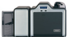
Kartendrucker/Kodierer für beidseitigen Druck